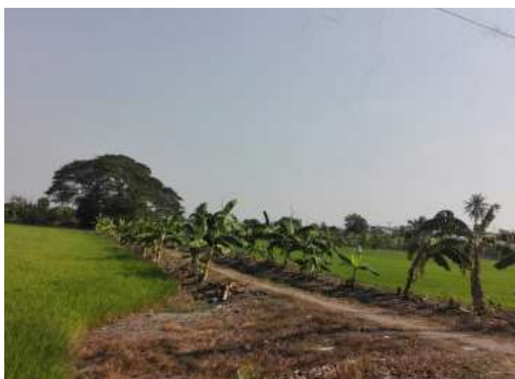
รูปที่ 4 ต้นกล้วยที่ปลูกบนคันนา