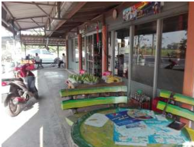
รูปที่ 7 ร้านค้าในชุมชน

ในหมู่ที่ 8 มีร้านค้าทั้งหมด 5 ร้าน ไม่มีตลาดในพื้นที่ ชนิดสินค้าที่ขายได้แก่สินค้าสำหรับอุปโภคและบริโภคพื้นฐานในครัวเรือน หน้าร้านค้าบางแห่งมีสินค้าฝากขายได้แก่ กล้วย