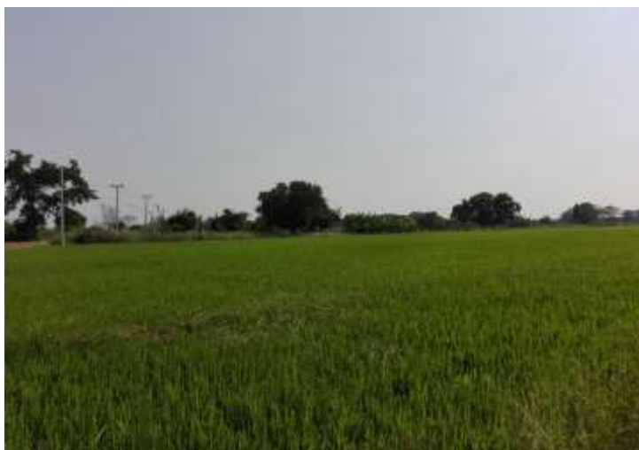
รูปที่ 2 นาข้าวในพื้นที่หมู่ที่ 8 บ้านคูขวางไทย