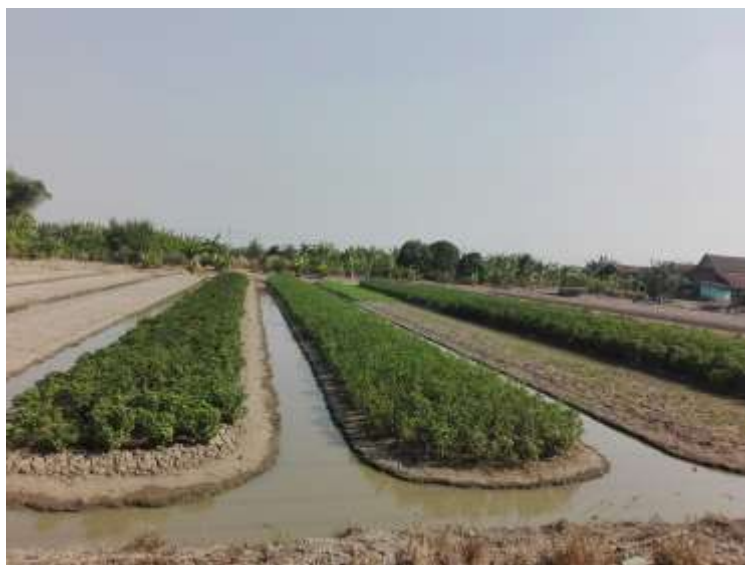
รูปที่ 6 การทำสวนผักในพื้นที่หมู่ 8

ส่วนใหญ่ประกอบอาชีพหลักคือเกษตรกร รองลงมาคือรับจ้าง ส่วนอาชีพรองได้แก่การปลูกกล้วยน้ำว้า กล้วยหอม ปลูกผัก ้วยแรงงานบางส่วนประกอบอาชีพเป็นพนักงานในโรงงานอุตสาหกรรม