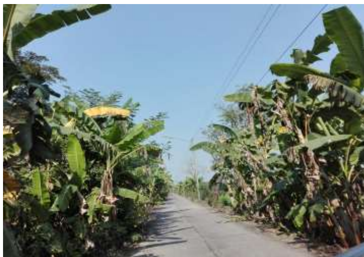
รูปที่ 3 ต้นกล้วยที่ปลูกบริเวณริมถนนในหมู่ที่ 8 บ้านคูขวางไทย