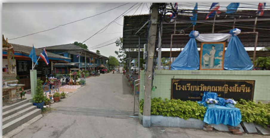
ภาพที่ 2.5 แสดงภาพโรงเรียนวัดคุณหญิงส้มจีน

คนในชุมชนส่วนใหญ่สำเร็จการศึกษาในระดับมัธยมศึกษาตอนปลายหรือเทียบเท่า ซึ่งจะประกอบอาชีพรับจ้างในนิคมอุตสาหกรรมนวนคร สำหรับผู้ที่สำเร็จการศึกษาในระดับประถมศึกษาจะประกอบอาชีพค้าขายภายในชุมชน และมีเพียงส่วนน้อยที่สำเร็จการศึกษาในระดับปริญญาตรี ซึ่งจะประกอบอาชีพเป็นพนักงานบริษัท ข้าราชการ หรือพนักงานของรัฐ