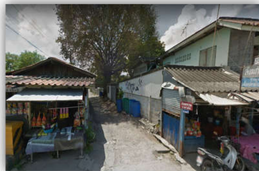
ภาพที่ 2.4 แสดงลักษณะบ้านเรือนภายในชุมชน