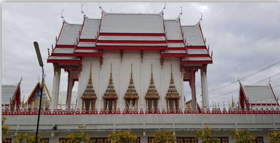
ภาพที่ 2.6 แสดงภาพอุโบสถวัดคุณหญิงสัมพันธ์