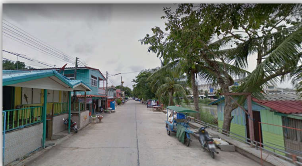
ภาพที่ 2.3 แสดงภาพถนนภายในชุมชน

ชุมชนวัดคุณหญิงส้มจีนเป็นชุมชนที่มีถนนหลักตัดผ่านกลางชุมชนจำนวน 1 เส้นทาง คือ ถนนพหลโยธิน ซึ่งเชื่อมระหว่างกรุงเทพมหานครและภาคเหนือ ภาคตะวันออกเฉียงเหนือ และจังหวัดใกล้เคียงที่สะดวกและรวดเร็ว ใช้เป็นถนนหลักในการคมนาคมเข้า-ออกระหว่างภายนอกและภายในชุมชน นอกจากนี้ภายในชุมชนยังมีถนนเล็ก ๆ ตัดผ่านบ้านเรือน เพื่ออำนวยความสะดวกในการติดต่อสื่อสารภายในชุมชน อีกจำนวนหลายเส้นทาง