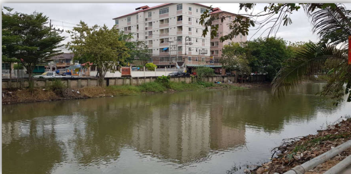
ภาพที่ 2.2 แสดงภาพคลองหนึ่งที่ผ่านกลางชุมชน