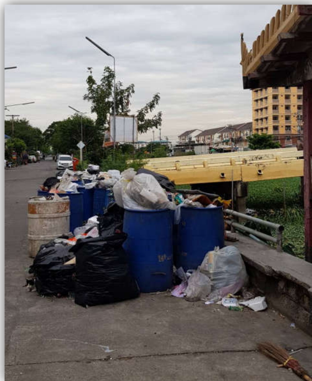
ภาพที่ 3.3 แสดงภาพปัญหาขยะมูลฝอยล้นถังที่เกิดขึ้นในชุมชน

1. มีการจัดการกับสิ่งแวดล้อมไม่ดีเท่าที่ควร สิ่งแวดล้อมโดยทั่วไปในพื้นที่ถึงจะอยู่ในระดับดีแต่ชาวบ้านบางกลุ่มยังขาดการบริหารจัดการที่ดี โดยเฉพาะปัญหาเรื่องขยะมูลฝอยที่พบในชุมชน เนื่องจากบ้านในแต่ละหลังในชุมชนยังมีถังขยะไม่ครบทุกหลังคาเรือน และทางหน่วยงานราชการไม่ได้กำหนดวันในการมาเก็บขยะในชุมชนที่ชัดเจน ทำให้ขยะที่เกิดจากบ้านแต่ละหลังในชุมชนล้นออกมานอกถังขยะ