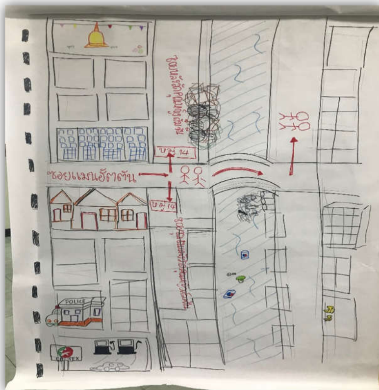
ภาพที่ 3.1 แสดงแผนที่เดินดินของชุมชนวัดคุณหญิงสัมพันธ์

จากการจัดทำแผนที่เดินดิน พบว่า ชุมชนวัดคุณหญิงสัมพันธ์มีหมู่บ้าน บริษัท และวัดคุณหญิงสัมพันธ์ เพื่อทำกิจกรรมชุมชน ซึ่งปรากฏข้อมูลแผนที่ของชุมชนโดยรอบที่ทำการสำรวจ ดังภาพที่ 3.1